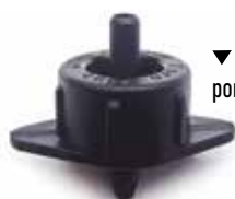
▼ Base Nera portata nominale 4 l/h