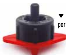
▼ Base Rossa portata nominale 8 l/h