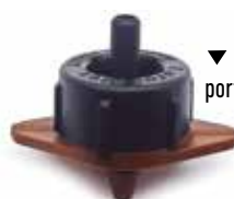
▼ Base Marrone portata nominale 16 l/h