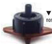
▼ Base marron débit nominal 16 l/h