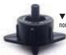
▼ Base noire débit nominal 4 l/h