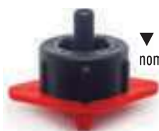
▼ Base rouge débit nominal 8 l/h