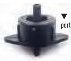
▼ Base Nera portata nominale 4 l/h