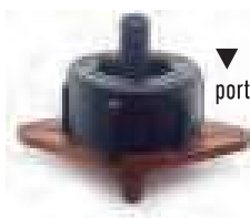
▼ Base Marrone portata nominale 16 l/h