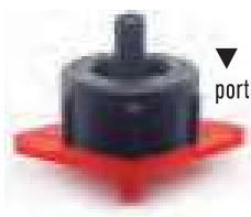
▼ Base Rossa portata nominale 8 l/h