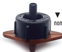
▼ Base marrón caudal nominal 16 l/h