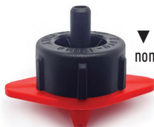
▼ Base roja caudal nominal 8 l/h