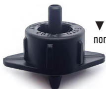
▼ Base negra caudal nominal 4 l/h